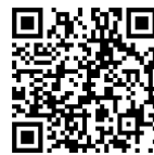
Memory: 「愛と喪失の4つの 歌」について